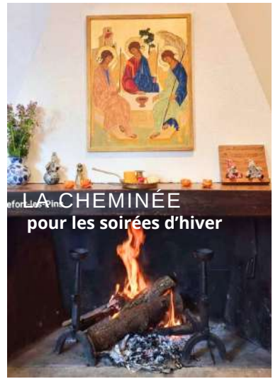
LA CHEMINÉE pour les soirées d'hiver