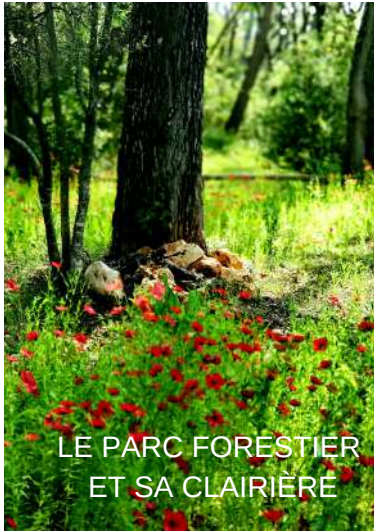
LE PARC FORESTIER ET SA CLAIRIÈRE