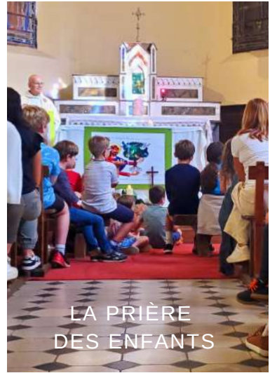
LA PRIÈRE DES ENFANTS