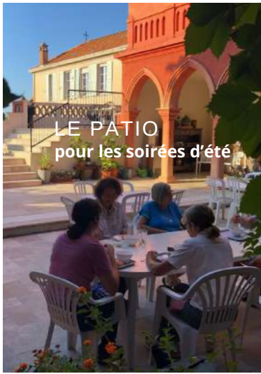
LE PATIO pour les soirées d'été